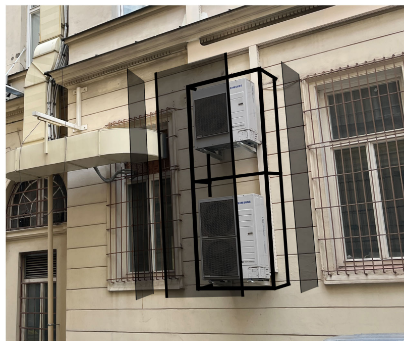
NOSNÝ RÁM JEKL 30X30 MATNÁ ČERNÁ HLINÍKOVÁ LAMELA ZAVĚŠENÁ NA MOSNÝ RÁM PRO SERVIS SNÍMATELNÉ